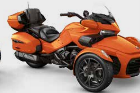
ORANGE PHOENIX MÉTALLIQUE* Édition Noire