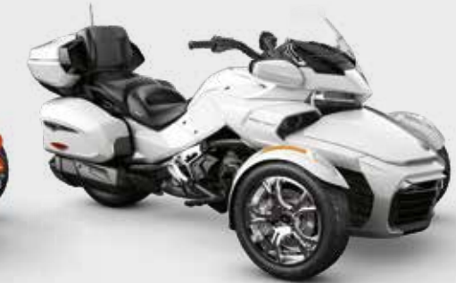
BLANC PERLÉ* Édition Chrome